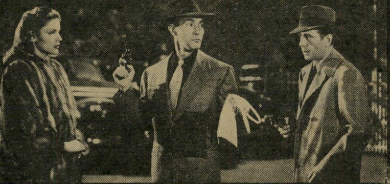
האמפרי בוגארט, פול וובר וז'ורן בקוק "השונה הגדולה" — 1946

רך. ובכל זאת, האווירה המיוחדת במיינה של הסרט, הופעתו של בוגארט והי בימוי של הוקס הבטיחו לשינה הגדולה (המוצג לעתים גם תחת השם התרדמה ה' ארוכה) מקום של קבע בכל קורס ראוי לשמו על תולדות הקולנוע. השנים חלפו, האופנה חוזרת. מארלו, אותו גילמו בעבר הרחוק שחקנים נוספים מלבד בוגארט (כמו דיק פאוול, רוברט מונטגומרי או גיימס גארנר), שוב באופי נה. רוברט אלטמן ניסה, בצורה לא מוצלחת, לכפות את אישיותו על אליט גולד, כשהוא מעביר את הסיפור לתקופתו. דיק ריצ'רדס הצליח הרבה יותר, עם רוברט מיצ'ם בתפקיד הראשי, כאשר עדיף ליחזרו מארלו במקור, ועתה, מארלו רוכב שוב, ולא זו בלבד שהחזרו בפעם נוספת אל