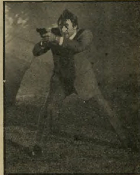
שחקן רוברט מיצ'ם מארלו לפי מידה

לא רק את הקוראים אלא גם את הוליווד, שמהירה להעסיק את צ'אנדלר כתסריטאי — עיסוק שהוא שגור בכל לבו — ולר כוש את ספריו כדי לתרגם אותם אל הבד. נרקומנים ונימפומניות . שבע שנים לאחר שנכתב, הפך השונה הגדולה לסרט, אחד הסרטים הקלאסיים של אותה התקופה, כבימויו של הווארד הוקס ובהשתתפות האמפרי בוגארט ולורן באקול. צוות התסריטאים שהכין את המעבר משפת מילים לשפת תמונות (שמנה, בין היתר, את מי שזכה מאוחר יותר בפרס נובל, ויליאם פוקנר) נאלץ לוותר על מרכיבים מקוריים רבים, שהקולנוע התבייש אז לטפל בהם, כמו בעיות סמים, צילומי עיר רום וכיוצא בזה. צ'אנדלר התכחש לעירי בוד, משום שלא נראה לו נאמן די הצור