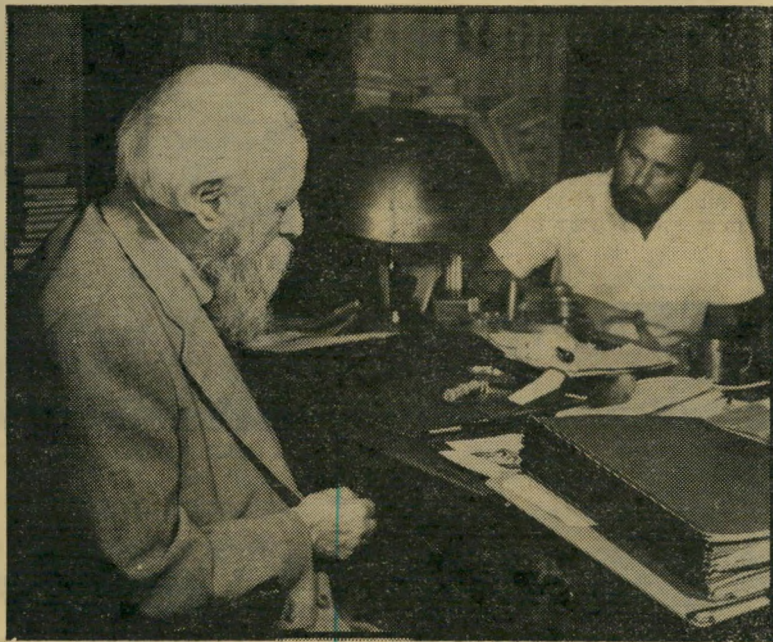
לפני 25 שנים העניק הפרופסור מרטין בובר ראיון מיוחד לעורך "העולם הזה". הדברים פורסמו ב-21 בינואר 1954 ("העולם הזה" 848), והם מתפרסמים שוב בעמוד זה, כשונם וככתבם, ללא השמטות. למרות שחלפו ימות-ידור מאז השמיע הוגה-הדעות המנוח את השיחות עם טיב היחסים שבין שני עמיהאריק, נראים הדברים אקטואליים היום לא פחות משהיו בשעת נתינתם.

בשעת הראיון הענה עורך "העולם הזה" גם שאלות בנושאי הדת והמדינה. בובר השיב עליהן בפירוט, אך חלק זה של הראיון לא פורסם בשעתו, לפי בקשתו המפורשת של בעג הדברים. למרבה הצער אבד החומר במרוצת השנים.