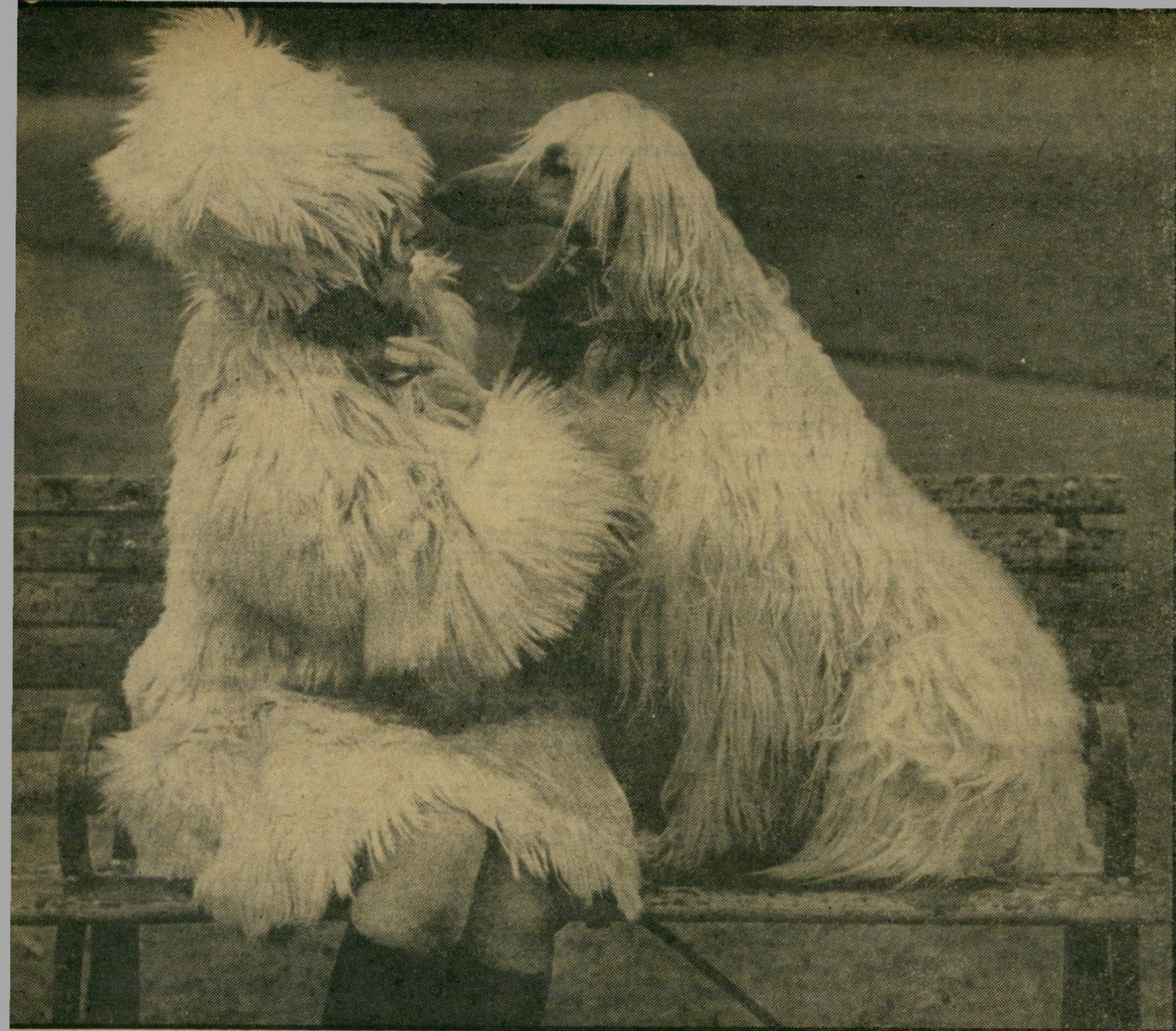
אשה וכלבה לדעת לקרוא את הבעת האדון

בימי חיינו אנו אוספים, ממיניגים ומתיי-קיים" אי-שם בנכבי תודעתנו מיליוני-מילי-יוני רשמים, יש לנו בלא-הרהף חוויות וניסיונות עם בני-אדם. בין השאר, נוצרת בר-תהיכרה שלנו תמונה של "הרמאי", מתחת לסף ההכרה אנחנו קולטים הבעות, פנים ותגובות גופניות אחרות, הנקשרות