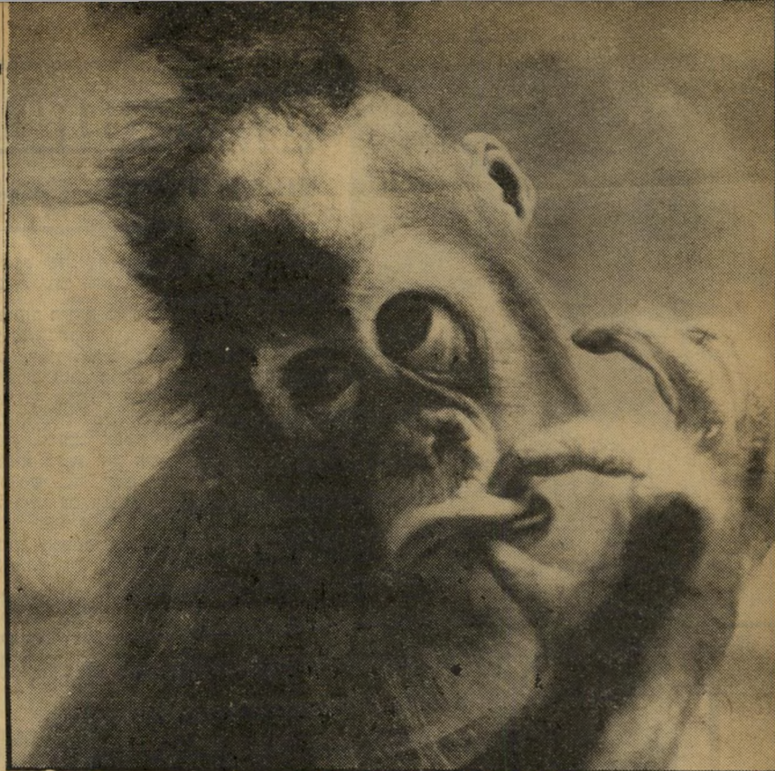
בן למישפחת הקופים שפה של קולות, תנועות והטויות