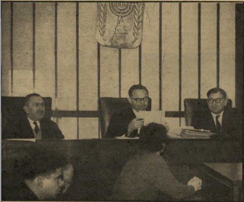
שופטים בדיון מישפטי לא במקום, אלא נוסף

דבר, יהיה זה תלוי בשופט אם להאמין למימצאי-המכונה בנסיבות הנתונות, ואי זה מישקל לייחס להם. אך במכשירי-עזר — נדמה שי הגלאי יכול להביא תועלת רבה מאד, להקטין על עבודת השופט,