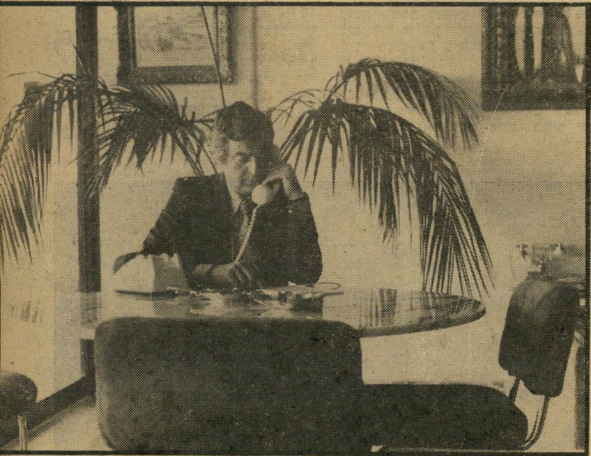
ח"כ פלאטו-שרון בווינה שמו בכספיו הסתגר בביתו

רק"ח מאיימים לרצוח אותו. אחריכך נולד בנו של פלאטו, וזו היתה לו סיבה נוספת להישאר בבית. לאירועים רישמיים הוא לוקח עימו את רעייתו, שכן, הוא חושב שיהיו במקום צלמים. אך לאירועים עים לא רישמיים, כמועדוני לילה, הוא הולך עם אחד מעוזריו או עם נהגו.