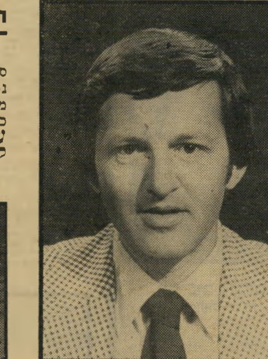
עורך שטרן עליה בחדשות

ריך את זמן שידורי מיבוקיו עד לחמש אחר הצהריים. בעתיד הקרוב מתכוונים להחזיר אותו למתכונת הישנה, עד אחת בצהריים, ואחר-כך לבטלו כליל. רק מיבוקי הידיעות מ"א אחר הצות