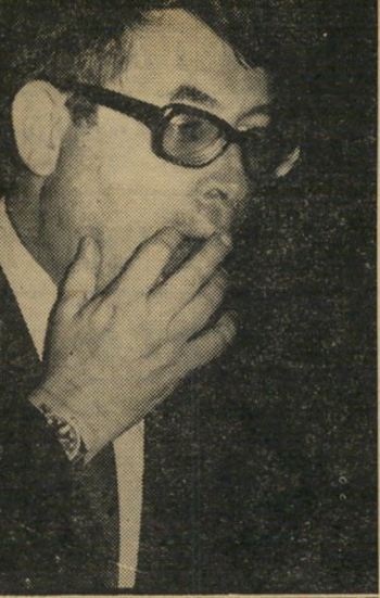
מנכ"ל ליבני קשר ישיר

להבליט במיוחד את העובדה שיש מועמד דים אחרים לתפקידו, ואם כותבים על מועמדים אחרים, לציין גם את האפשרות שהקדנציה שלו תוארך.