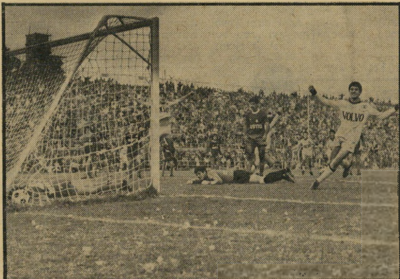
אדי מיאלי (מימין) מבקיע את שער מכבי תל-אביב „הו, הא, מה קרה —

הקהל הירושלמי, שכבש את איצטדיון בלומפילד בכמותו ובסיגנונו — „נוסח אנגליה“ — הרעיש עולמות כאשר אלי