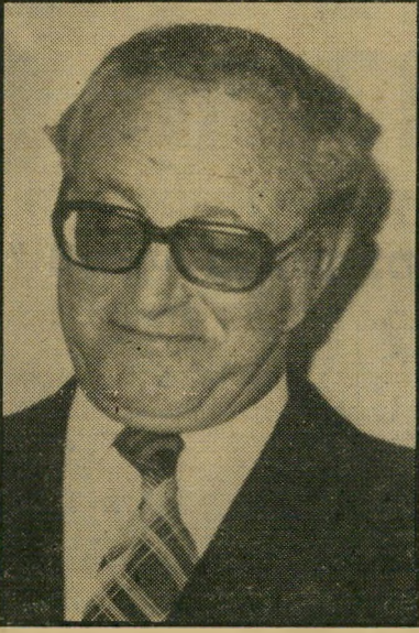
ח"כ זיידל חונדוני-יילה