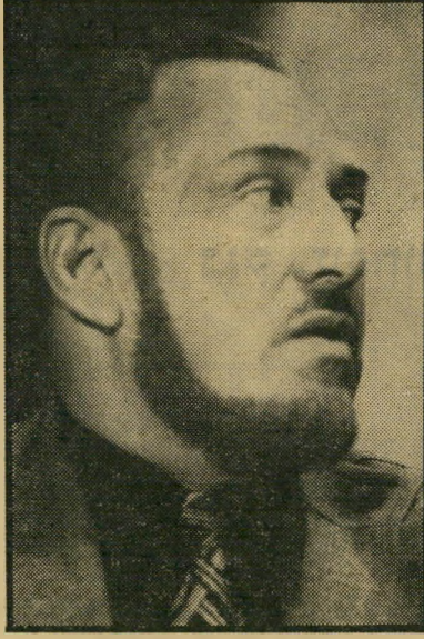
ח"כ מלמד גוף יפה

נוסף לוויולה שלו, יש לפרץ דירה במר כו דימונה, אשתו אף היא מוסיפה לפרנסת המשפחה. היא משמשת כעובדת סוציאלית ומביאה הביתה כ-10,000 לירות בחודש.