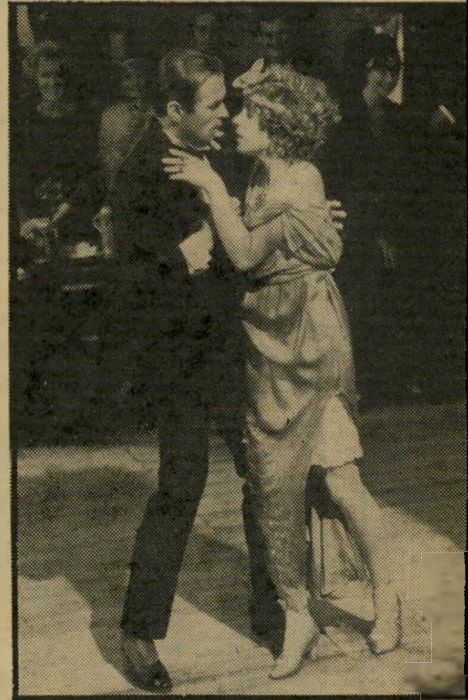
מילפורד רוקדת עם נוראייב כולם למדו אצל ולנטינו

מעריציו של קן ראסל ישמחו בוודאי לדעת שלא התמיצו לעולמי-עד את האפי שרות לראות את סרטו האחרון ולנטינו.