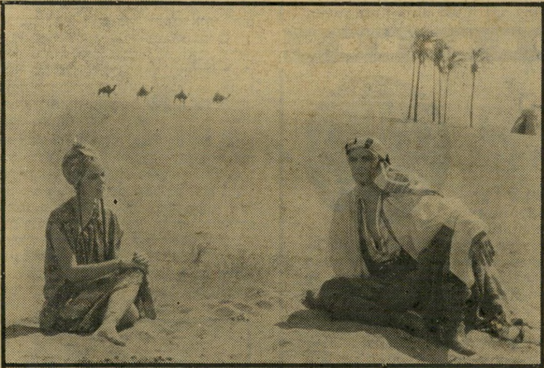
פיריפס ונוראייב במעמד מתוך „השייך“ טטירה על פני הכוכבת

ראסל, כך אמרו, רצה פעם להיות רקדן בעצמו ומשום כך בחר בנוראייב לתפקיד הראשי. לדברי לסלי קארון, שמופיעה בסרט, אבל אינה רוקדת: „ראסל הוא