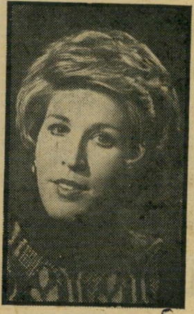
אופרה : מזוז שעה 9.30

ג'וזפה ורדי, האופרה צולמה בנוכחות קהל בתיאטרון לה-סקאלה במילנו, במיסגרת חגי-גות 200 שנה ללה-סקאלה. על נשף המסכות מנצח קלאודיו אבאדו, שהוא דמות מוכרת לקהל הישראלי בעיקבות הו-פעותיו הרבות עם התיזמורת הפילהרמונית הישראלית. אבא-דו הוא המנהל של לה-סקאלה ומשמש גם כמנהלה המוסיקא-לי של התיזמורת הסימפונית של לונדון. על הביצוע הבימתי וההקלטה לטלי וויזיה היה אחראי פראנקו זא-פירלי, שביים כמה סרטי קולי-נוע, ביניהם רומיאו ויוליה ואילוף הסודרת. זאפירלי הוא