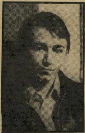
רמפוד: גיין שעה 10.00

ארמת סורגים (9.30), סרט-תעודה מצויין של אביב מוזס, המתאר את בית-הכלא הגדול בעולם, ברית-המועצות, בעזרת ראיונות עם אסירים-לשעבר וציי