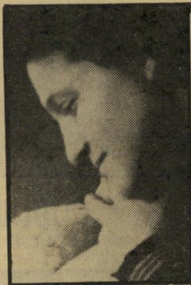
בן-גוריון: פודה שעה 10.15