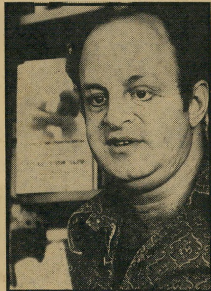
נאשם כר פעמי געולה

מכאן ברור שלפני השופט שדן בדיני תועבות, ניצבה משימה לא-קלה של ביקור-רת סיפורתית לשמה, זוהי אחת הסוגיות