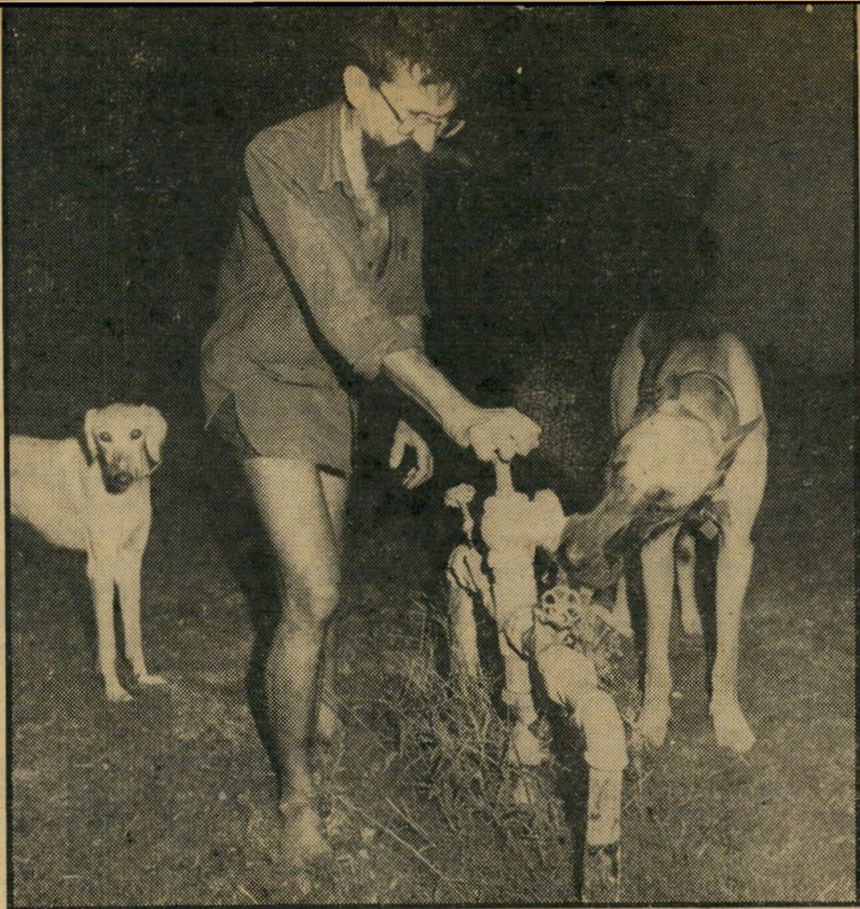
חברי-קיבוץ צור על מסלול המארתון

מות חול, תפקיד שעבורו קיבל שכר של 200 ל"י לחודש. כיוון שמקום מגוריו היה רחוק מבית-הכנסת, לא יכול להגיע בשבתות. היכרותו עם בית-הכנסת נצח-ישראל החלה לפני שנים רבות. עת עבד כגהצן במיכסה ליד התחנה-המרכזית, מי אחר שהתגורר ברמת-אביב היה לו נוה להגיע לתפילת שחרית לבית-הכנסת הקרוב למקום עבודתו.