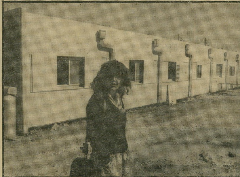
יחידות-דיור בקרני-שומרון* אידיאולוגיה לחוד -

המגמה של קרני שומרון היא לקבל למקום גם מישפחות חילוניות, המוכנות לשמור על ציביונו הדתי של המקום. התושבים מתגוררים במיכנים טרומיים. זוג ללא ילדים גר במיכנה בן חדר אחד. זוג עם ילד עד שלושה - בשני חדרים. זוג עם ארבעה עד שמונה ילדים מקבל ארבעה חדרים. חדר המגורים משמש בדרך- כלל גם כחדר-השינה של ההורים ומהווה יחידה אחת ביחד עם המיטבת. ככל המיכ- נים מותקן מזג-אוויר.