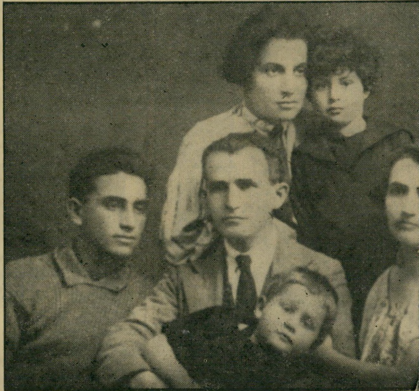
בית בן גוריון שצולם בשנות העשרים בירושלים