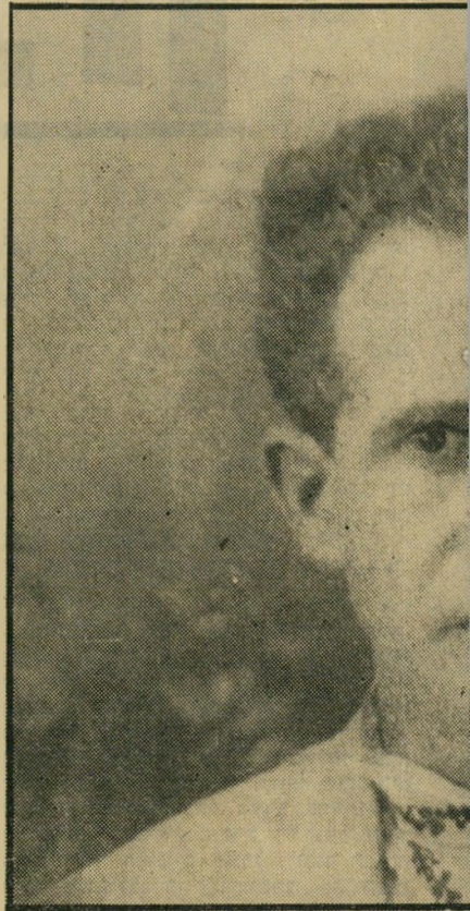
שראל כעבוד שנים אחדות