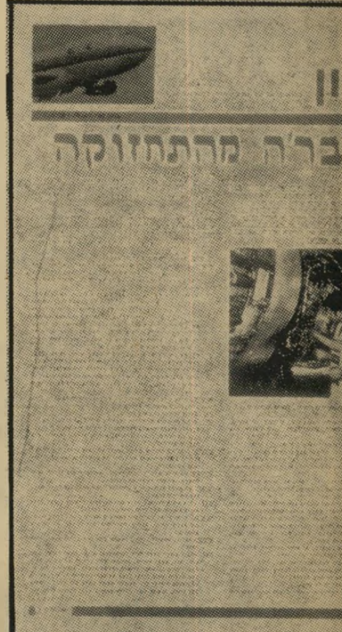
גליון ביטאון-המריבה החברה מהצנזורה

בעוד שיכלו לשכב במיטה בבתיהם בתליאכבי, ולצפות בשידור משם. אולם הטקס כולו עמד בסכנה חמורה של הפיכתו לקומדיה. שבועיים לפני הענקת הפרס העולמי, נכנס המשאומתן למבוי-סתום. היה נדמה כאילו מנוי וגמור עם ממשלת-ישראל