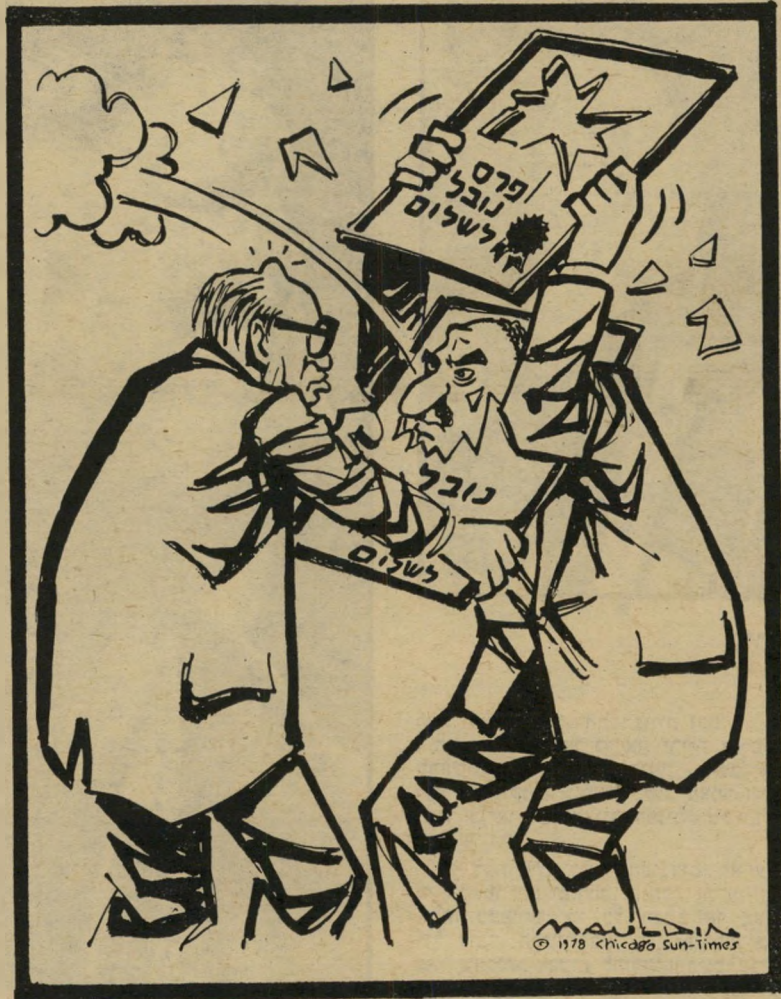
קאריקטורה של ביל מולדן בסאן-טיימס

תחת לנצל מומנט פסיכולוגי זה כדי להשיג פשרה, התעקשה ממשלת-ישראל לדחות את המועד. תחילה דחתה את ההצעה האמריקנית בעניין ה"חביר" בין הסכם-סיני והסכם-הגדה-הירצועה. לאחר-