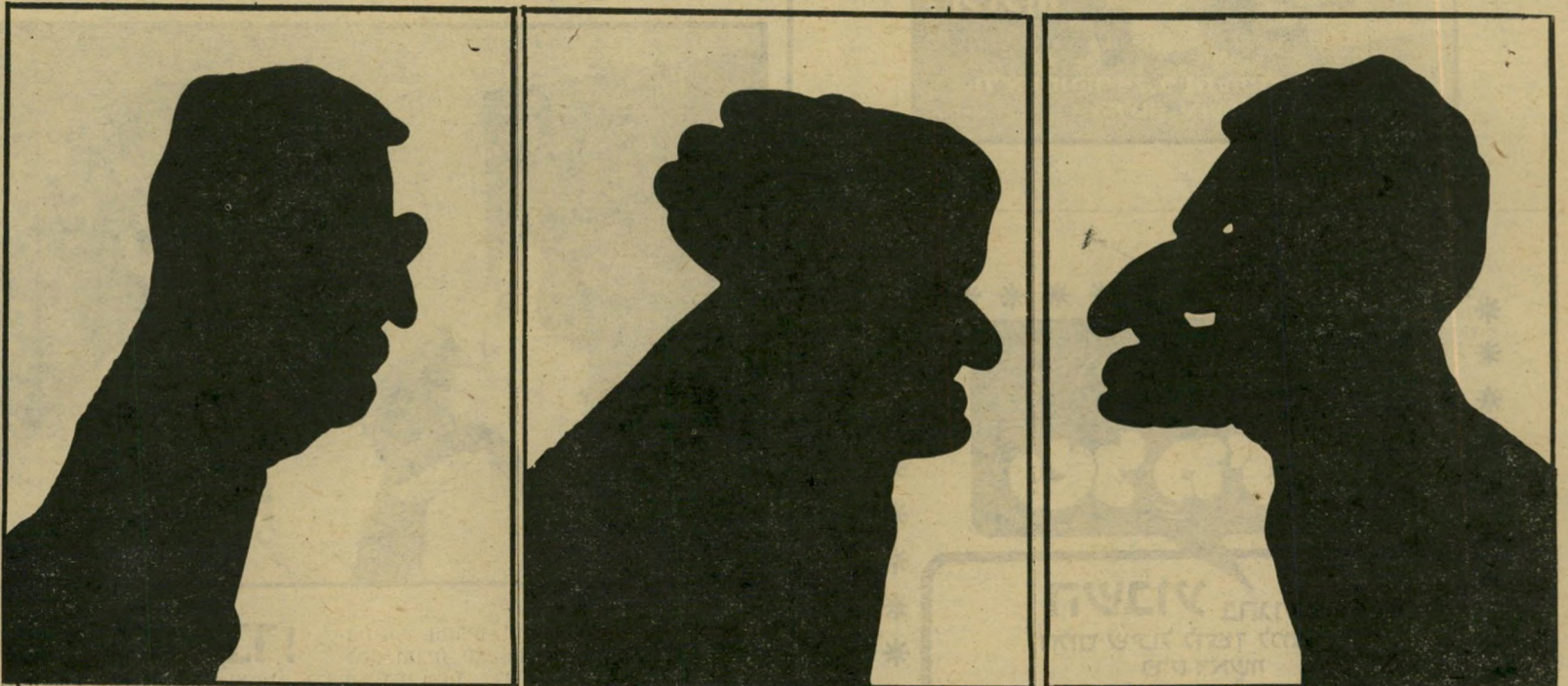
הצלליות של אלמוזנינו: גמאל עבד-אל-נאצר, דויד בן-גוריון, אבא אבן, האצבעות הן רכות ועדינות, ואין להן קווים חדים...