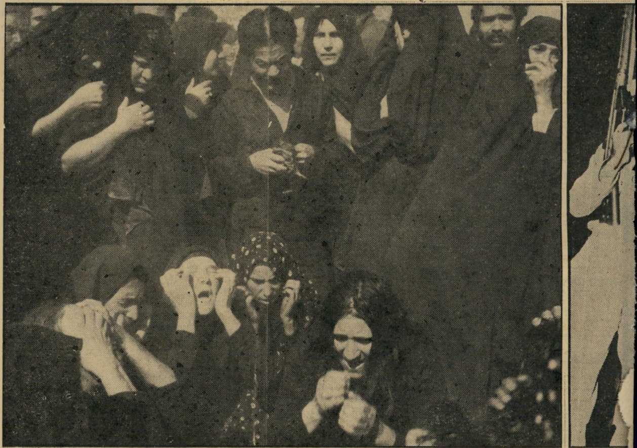
זעקת האמהות: הסכד לקורבנות היריות של הצבא