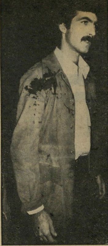
שומר ראש מזוכך כביצים על חשבון מי הנקיף?