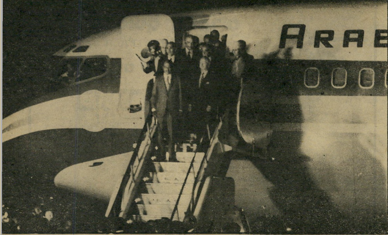
אנוור אל-סאדאדא מגיע ינמדיהתעיפה כןגוריון: 19.11.78

האורח שתה בצמח כל מילה שיצאה מפי אל-סאדאדא בכנסת, התרגש עד דמעות למראה הנשיא המצרי במוסד יד ושם, התגלגל מצחוק כאשר התלוצץ המצרי עם