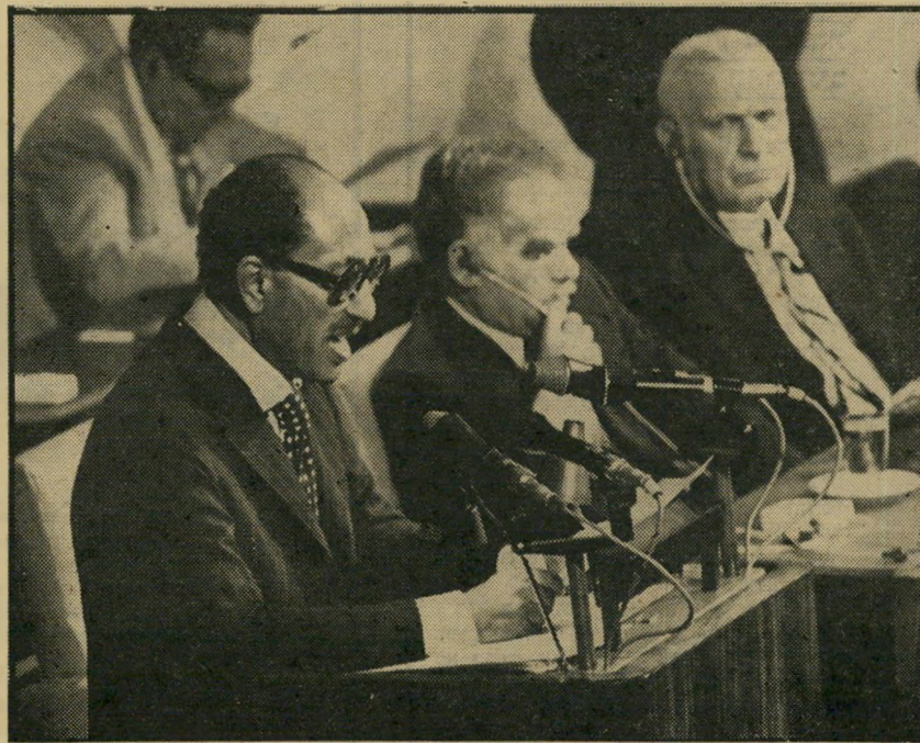
אל-סאדאדא נואם בכנסת: 20.11.78

לא היתה כל זכות למישהו בישראל להתמרמר או להתפלא על כך, שאל-סאדאדא העלה דרישות אלה שוב ושוב, ואף חזר עליהם השבוע. אדם ביכלל יכולה להיות