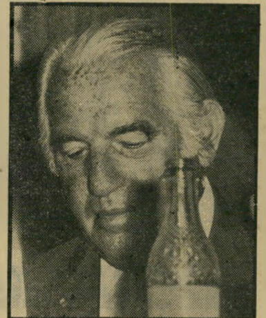
מר איזיק, עזרה מכויית

סר איזיק וולפסון ניצל לאחרונה מהפסד של כמה מיליוני לירות סטרלינג תודות למשקיעים מכוויית. בעלי-הון כוויי- תיים הם בעלי חברה בשם "ארטוק בנק אנד טראסט". "ארטוק" רכשה ב- אחרונה חברה אמריקאית בשם "ליי