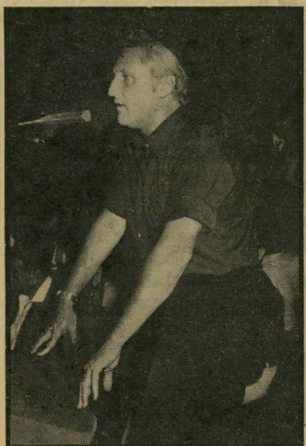
ציצי' תשובה לניצנים

ברור שלמיפלגה הליברלית דרושים כיוון חדש, ומנהיגות שיש לה היכולת