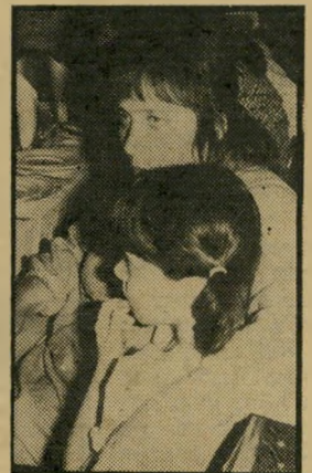
שאלה: חריפאי שעה 5.30

גי כ-40 שנה, קראו לו מיכאל סטרוגוף. בסרט של הבמאי הר איטלקי קארמינה גאלונה קורי אים לו מישל סטרוגוף. קורט יורגנט משחק את שליח הצאר הנוסע למושל אירקוק, כדי להזהירו מפני הטאטארים. הוא נתפס על-ידי הטאטארים וער בר עיניים. הטאטארים, שגיי לו כי סטרוגוף הוא מרגל, מחליטים להענישו ושורפים את עיניו. אל פי וורן ככה סטרוגוף בעת שרפרו את עיי גיו בברזל מלובן. הדמעות הפרידו בין הברזל לבין העין והצילו את מאור עיניו של סטרוגוף. עולם הסרטים יותר ריאלי: וורן הצליח לשחד את אחד משורפיו וכך הציל את מאור עיניו. לצידו של יורגנט מופיעים בסרט ז'נביב פאז, סילויה קושינה ופראנסואז פאביאן.