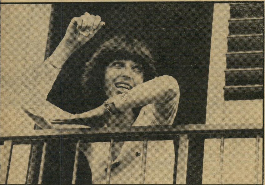
משכירה פונסקה מה אמרו לה?

הטיחה בגורודיש שתי ת. האחת, שהוא פרש ב' זכויות, ועם פרוץ ה' הוחתם השאיר מאחור, פרש את כוחותיו לפנים ורק שליש