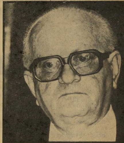
השר ארליך „מחשבה פראגמטית“