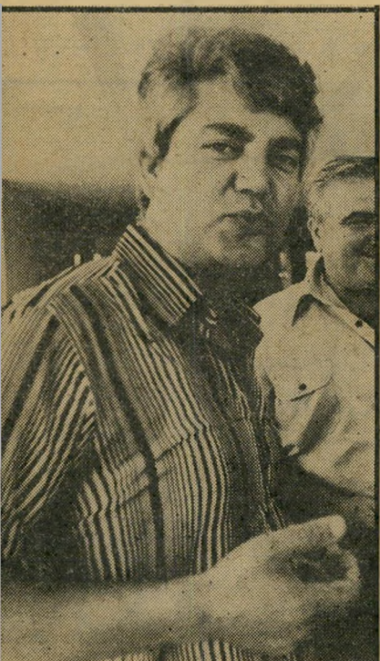
דויד לוי יוכפל?