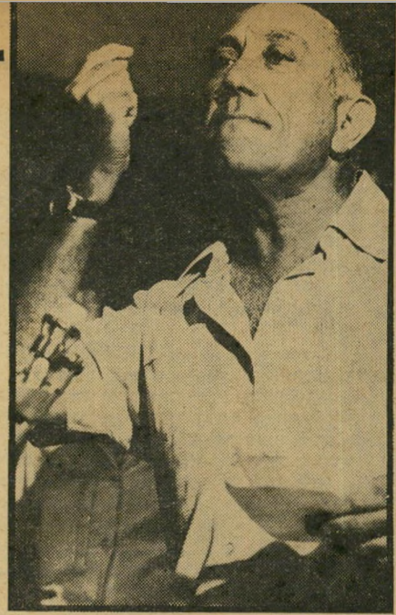
מאיר עמית יחזור?

ה תסיסה בתוך המיפלגות המרכזי בות את הקואליציה, ובתוך החטיבות המרכיבות את הליכוד, ביחס למיבנה הר ממשלה, הולכת וגוברת. כוונתו של ראש הממשלה היתה להקפיא, עד כמה שאפשר, את המצב הקיים, שבו חסרים בממשלה שני שרים שאחזו בשלושה תיקים. במצב זה אין כל קשר בין כוחן האמיתי של המיפלגות לבין יצוגן בממשלה. תחילה הודיע מנחם בגין, כי אין בכוונתו תו לעסוק בשיבוץ שרים או בשינוי הר כב הממשלה עד לסיום שיחות השלום וחתמת ההסכם עם מצריים. אולם ערב נסיעתו לארצות-הברית ולקנדה, אמר בגין למקורביו כי נראה לו שלא תהיה ברירה, אלא "להרכיב את הממשלה מחדש" לאחר שובו מהמסע בן השבועיים. פעולת השיבוץ תהיה קשה ומפרכת, לא רק בגלל הבעיות האישיות של אנשי מיפלגה הרוצים להיות שרים, אלא גם בגלל הפילוג בד"ש. הפילוג במחנה ידין