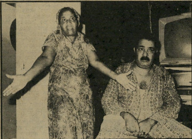
הורים אכזרים ומזל דהרי „אני משוגעת“

עמנואל סלום אני 717 371, כולל לואי, לך מלוא גחמך וכי-נספך במיק שבתי אני מלוא עיני וב ואולי לך למה ואור משלל את צדק אם מה שאתי אולי כר נכחן ויאת קן 51 אור במיר אמתל אמתלם לכולם כולל 51 אני