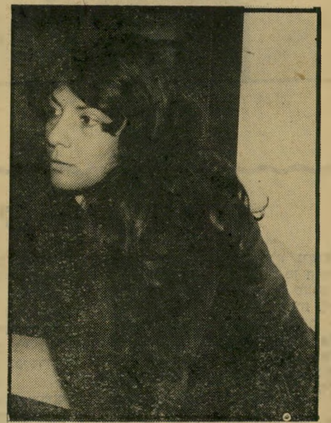
עורכת חן, רק את יבין

שריחניון זבולון המר החליט לאחרונה לעסוק יותר בענייני הרדיו והטלוויזיה מאשר עד כה. המר אומנם לא מתכוון להתערב במהות השיר דורים, אך מיספר עניינים מינהליים מעסיקים אותו. בעיקבות שיחת שקיים, בסדויות רבה, עם כמה מעובדי השותף-השידור והטלוויזיה.