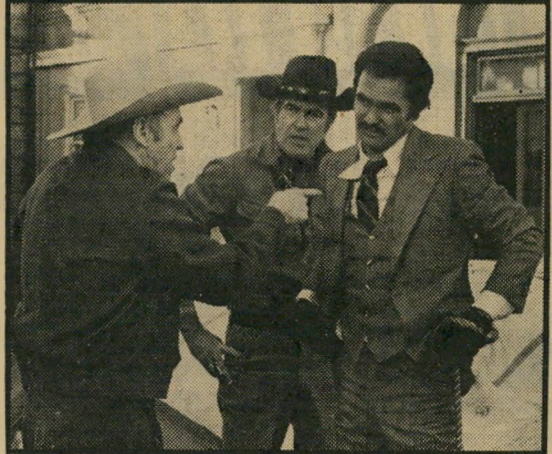
ברט ריינולדס — מינהגים הוליוודיים נלעגים

בין הכפיל לכוכב (שאותו מגלם אדם ווט, המוכר באמריקה כאיש העטלף) או היחסים בין הדוגים השונים של צוותי ההפקה בשעת ההסרטה. במיוחד מכוונים חיצונית הלעג כלפי הגאונים הצעירים של התעשייה, שפילברגים ולוקאסים למיניהם. מעלתו העיקרית של הסרט: כולם נהנו מאד מן העבודה בו, וההרגשה היא מדבקת.