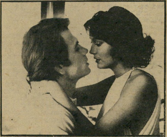
אן-דאון, לייג'ינס: וירטואוזיות מינית

אהבה אינה יודעת מצרים; הווירטואוזיות המינית קשורה ישירות בשאפתנות העיסוקית; אחת לרבע שעה מסירה אחת הנשים את בגדיה המיותרים וחולצת שד או שניים להנאת הציבור, בסצנת-מיטה גדושה חירחוריתאווה מני-זעים. מובן גם שכל מי שמסתובב על המסך, ויש לו מש-מעות כלשהי, מסריח מרוב כסף והכסף, כידוע עונה את הכל.