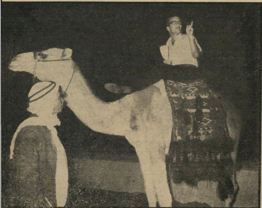
ח"כ שרד בהזמנת מי?