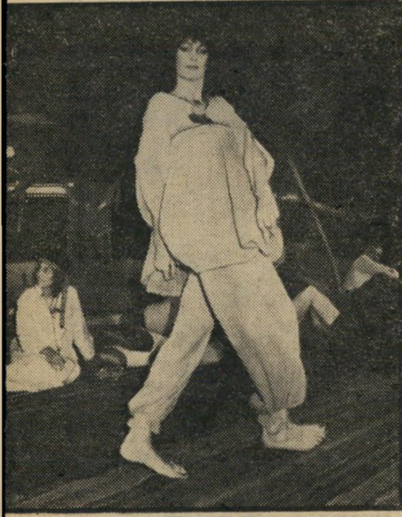
דוגמנית ישראלית מראה מידורי

קשה יהיה להבטיח לציבור המבקש לבוא ולהתארח באוהל הבדואי, כי יוכל להיחרך בכמה חברייכנסת מדי ערב, אך בכל זאת כדאי לנסות. אולי יתמזל מזלם יזכו גם הם לראות את נבחריו העם זוללים אורז ובשר בידיים או מתנדנדים במרומי גמל עצבני.