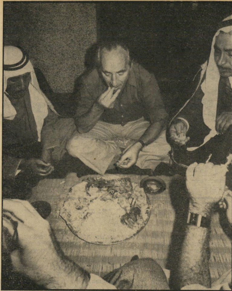
ח"כ פרס והבדואים בשר ואורז בידיים

א צריך להירחף. אין טעם להציטוף בכבישים ולדהור לסיני לפני שמחזירים אותה, כדי לראות בפעם האחרונה