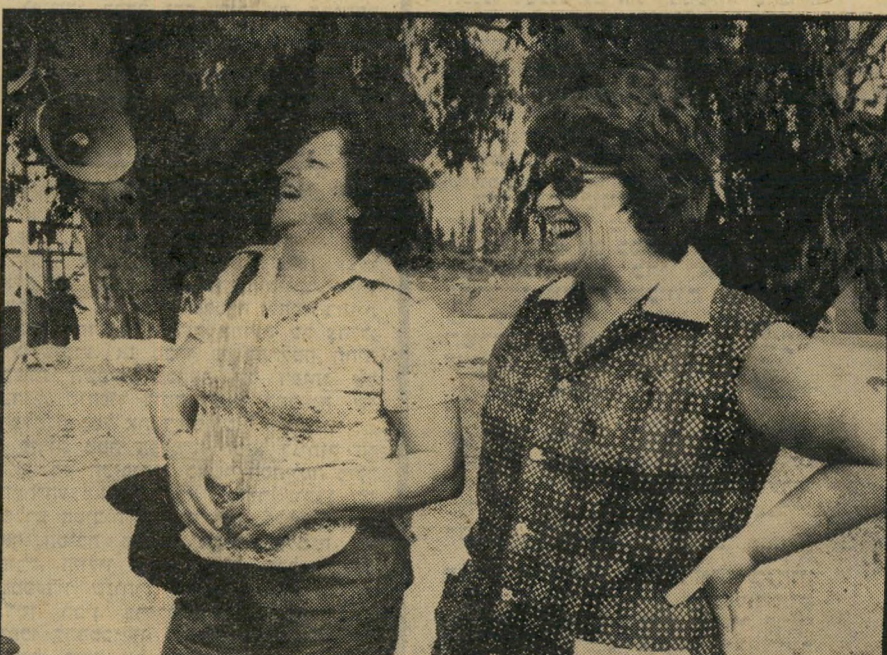
דור הדיסקו הדור השני של לוחמי הפלמ"ח. שלוש נערות שהגיעו עם אבותיהן לכנס הפלמ"ח, התבוננו בחדווה בדמויות האגדיות שעליהן הירבו לשמוע עלילות גבורה מפי הוריהן. ציים: שלמה פתח