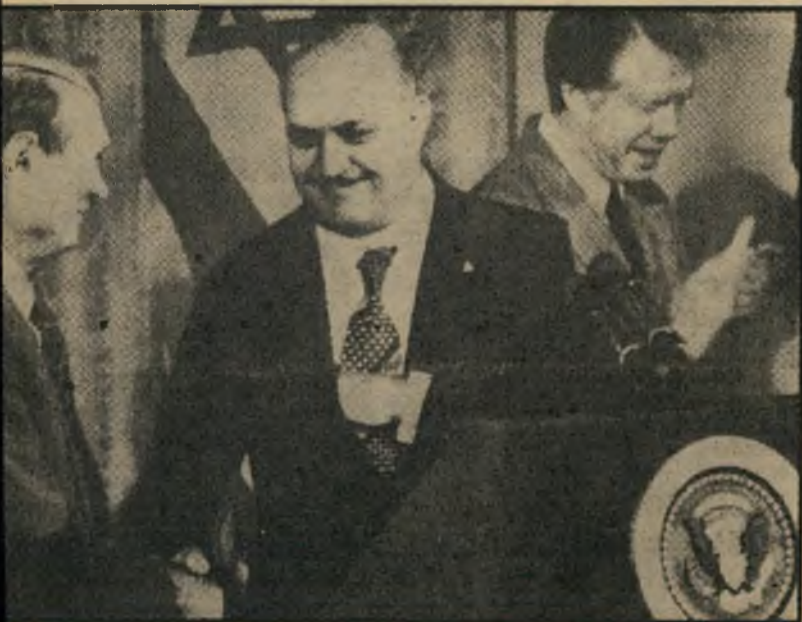
דיין דוחק בווינגטון את ידי חפן עדי, משקארטר מוחא כף הגולם קם על יוצרו

ת חת רושם זה נקראן משה דיין ועוזר וייצמן להתייעצות בישראל. הקריי הבתולה נותרה נתוקה גם אחרי של דיין כבר עשה את שלו בעיר להשיג פשרה לל הבעות לל דיין