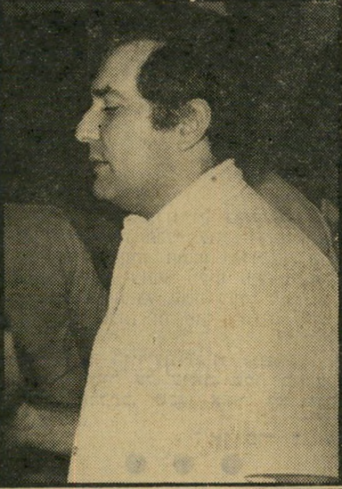
רב-פקד סנדרו מזור "לא רוצה להזדהות"

את מעשיו של מזור יחקרו הרשויות המוסמכות, ומיכתב-תלונה רישמי בנושא כבר שוגר. נותר רק ההיבט הציבורי, ובעיקר זה הנוגע לחופש-הדיווח העיתוני נאי. עד כה היתה צפויה לכתבים לענייני פלילים סכנת התנכלות מצד עבריינים או קרוביהם. כעת, כנראה, קיימת הסכנה גם מצד אנשי החוק עצמם.