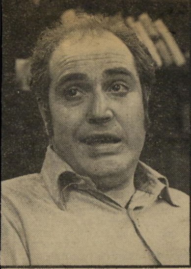
ארצי מפיך הכל נשאר במשפחה חזה בתיקו וטען: "הוא דומה לארצי יותר משארצי דומה לעצמו."