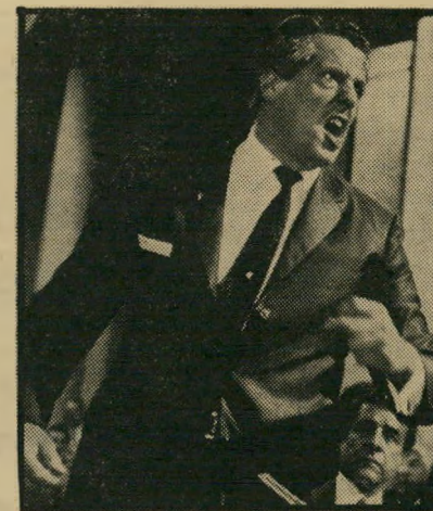
סטאלונה בדמות קובאקי' מורא וטרור