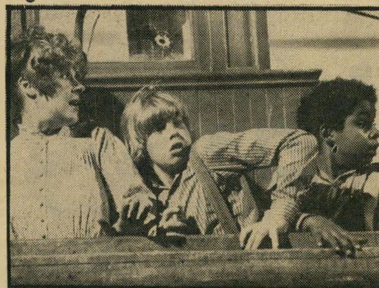
האקט ודוראן — מישיחק מתחנחן

קורטוב של הרפתקות נוסח שודדיהים, וקצת אינדי-אנים צבועים צבעי מילחמה, ומיסתרי שמורות-הטבע של דרום-פלורידה, כל אלה עוזרים להפיח רוח-חיים בסיפור הזה, כשצילומי חיות נדירות מן המלאי הקבוע של דיסני ממלאים מדי פעם את החסר.