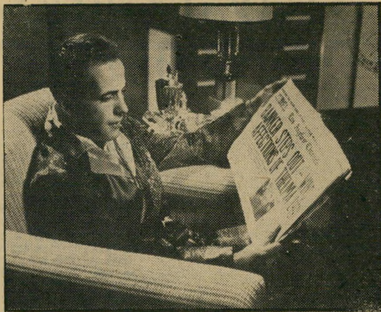
האמפרי בוגארט — הסתבכות רומנטית

על היצירה, כמו הספסרות באולפנים קטנים שנאכלו על-ידי הגדולים, כמו המאבקים המיקצועיים לשמירת מקור-מות-העבודה. אבל העניין אינו הופך לרציני, ומה שחתי-רחש באמת מאחרי הקלעים ממשך להיות פרוע מדי עבור סרט הוליוודי נומוס.