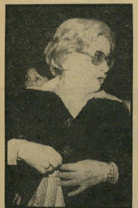
כדיבוטק: בגין שעה: 8.30

הכט אחרה באימה (10.20) פאראפרזה על הבט אחרה בזעם של ג'ון אוסבורן, במסיגרת ברטה. מסתבר כי לברטה יש עוד רווחים מעבר