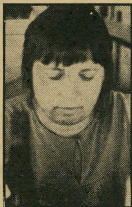
בצאת השבת: הריפאי שעה: 8.00

בחסידות, וסביב כתביו וחיו נוצרו כמה מהאגדות והסיפורים היפים ביותר ביהדות. שפינסו רבים מהסופרים הדיתיים וההילוניים שבאו אחריו, להדייטות ידוע רבי נחמן מן הרחובות הקרויים על שמו בערים השונות ותוכניתו של