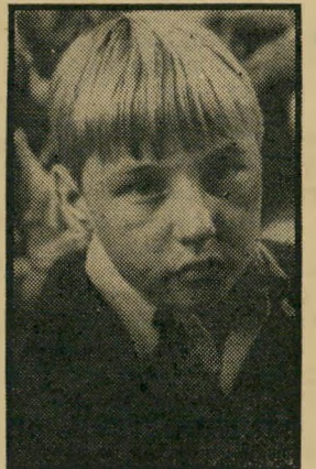
ילדות מאושרת: וודדה שעה: 9.00

מסע בין כוכבים (3.00) סיפורה זו מתחילים להיות דור מים זה לזה. האנטרפרייז יוצאת לכוכב פ.ס. 2000. ספוק ואיש צוות נוסף בשם טורמולן יורדים לכוכב ומגלים, כי כל חברי הצוות המדעי שהיו עליו ניספו. עם שובם לאנטרפרייז מתחיל טורמולן להתנהג בצורה מורגה. ונראה כי מגיפה של התנהגות מורגה מתפשטת על פני הספינה כולה. אחד מאנשי הצוות מתנהג כאילו היה סייף במאה 18. טורמולן מת ואיש צוות אחר משתלט על חדר המכונות. טוען כי הוא מפקד הספינה, האנטרפרייז נסחפת לעבר הכוכב העומד להתפוצץ. באה שבת (8.05) כוכבת השבוע היא סנדרה ג'ונסון, שכוכבה דרך בשמי הזמר הישראלי כשהועלתה הציגה לזיכרה של אדית פיאף, אך נעלמה מייד כשנשכלה.