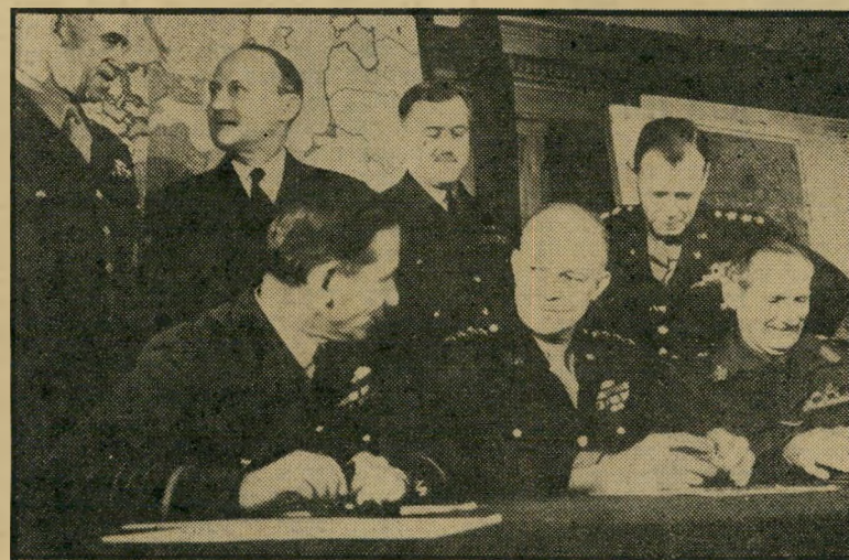
מונטגומרי (מימין) ואייזנהואר (במרכז) טיפש, אגורמאניאק, גנרל כושל, כטייל גמור, בובה חייכנית

זה את כל התוויות האפשריות. אחרי ש' הדביקו שם עיטורים. אייק תיאר את מונטי כטיפש, כאגורמאניאק, כגנרל כוזב, כחורש-מזימות וכמפריסקודות. מוני טי תיאר את אייק ככסיל גמור, כיושבי ראש של חברה מיסחרית שאין לו הבנה צבאית מינימלית, כבובה חייכנית, כאדם נטול כושר-החלטה.