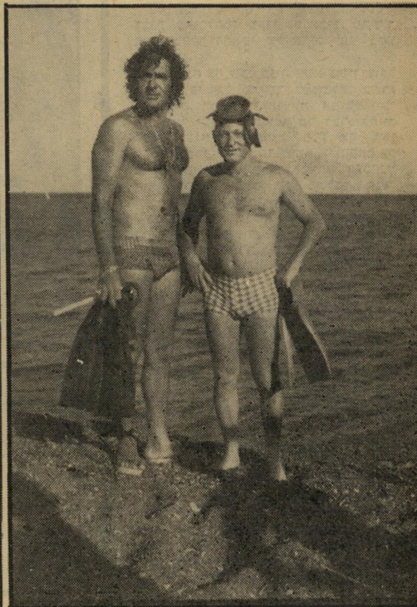
האלוף אדן (מימין)