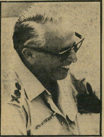
רבי-אלוף (מיל) צור בהמתנה למעידה