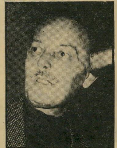
אלוף (מיל) פלד 12 החופלאים

"אלביט" רכשה את החברה הממ"שלתית "אלתם", יחד עם כל חוזי העבודה שהיו לה עם הממשלה, תמורת התחייבות שלא לפטר שום עובד. רבים בענף תמאים על רכישה זו, שכן חסרונה של החברה הממשלתית היה נעוץ במיס"פר עובדיה. בינתיים יש ל"אלביט" בעיות עם המחשב "פאקט" מתוצרתה. כעשרים יחידות של מחשב זה נמכרו בישראל, ועוד כמאה בצרפת, לחברת "רופ"י. רוכשי המחשב מתלוננים על כמה ליקויים בסיסיים בו, ושירות לקוי - ונראה כי לא צפויה לו הצלחה מיסחרית מלהיבה, אם לנקוט בלשון המעטה.