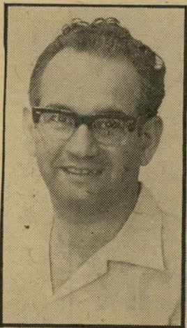
שארה: למדן שעה 7.00