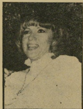
פירחי לונדון: ארז שעה 8.30

מוצאי יום-הכיפור בשידור שני של הקונצרט המפורסם שנערך ביום העצמאות בתיאטרון ירו-שלים, התמורת הסימפונית ירושלים רשות השידור עם הר-מצח גארי ברתיני מנגנת את