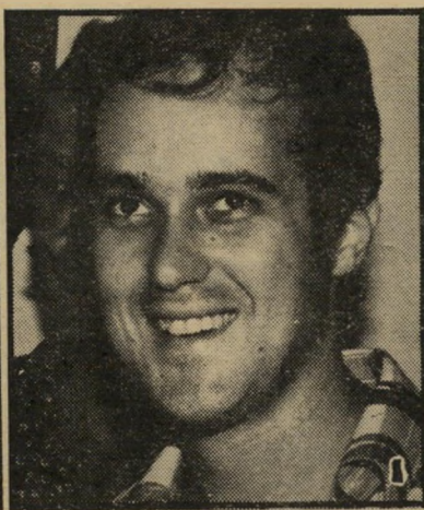
מנחה פאר צריך עוד להוסיף