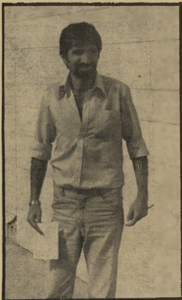
תפאורן גדיד מבט חזק

קשה להכין את ריצת-האמוק של קריינים ועיתונאים לקבלת התפקיד של מנחה עלי כותרת, כאשר מתברר מה השכר שאותו מקבלים דן מרגלית, מני פאר ויעקב ("יענקלה") אגמון. עבור כל הופעה מקבל המנחה סכום של 1500 לירות ברוטו. כל אחד מהשלושה עובד בעבודות מכניסות אחרות ועלי כותרת אינו מקור הפרנסה היחיד שלו. אגמון הוא מפיץ מרגלית כתב בהארץ ומני פאר שדרן ובדרן, כך שהמס, שאותו הם משלמים על