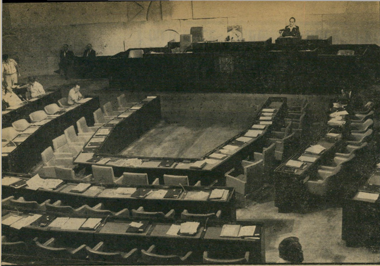
ח"כ אמנון לין נואם בכנסת בוויכוח ער הסכמי קמפ-דייוויד, לפני אולם ריק דיבר נגד ונמנע

* באפריל 1974 נכח משה דיין בבית-קברות צבאי, שם הפך מטרה להתקפות הורים שכולים שכמה מהם אף חבטו בו. תקרית זו השפיעה עליו בצורה כה עמוקה עד שהתייבב בפני ראש-הממשלה גדולה מאיר, והצהיר בפניה: "אני את הקאר-יירה הציבורית שלי גמתי."