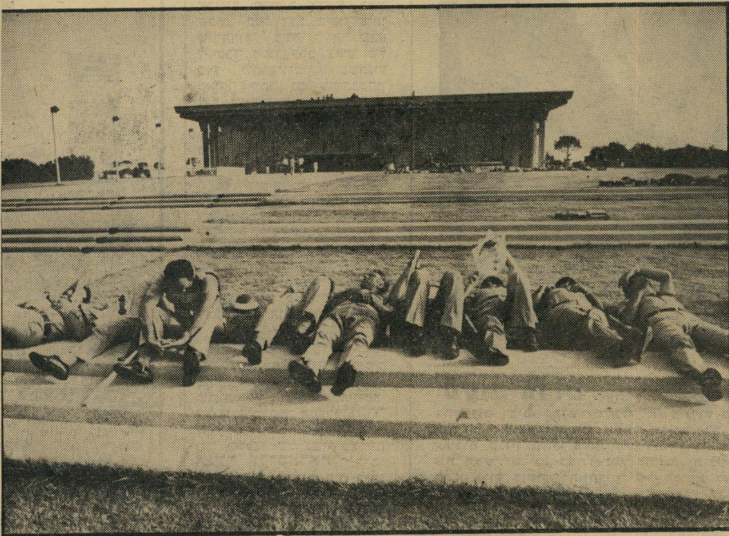
שוטרים ברחבת הכנסת, בעת הדיון על הסכמי קמפ-דייוויד: אין גייסות לגוש

אך תהיה התשובה על שאלות אלה כאשר תהיה — אין ספק שבצורה מודעת ובלתי-מודעת הושפע מהפגנות "שלום עכשיו". הן הבהירו לו כי חלק גדול מן הציבור מעדיף את השלום על השטחים.