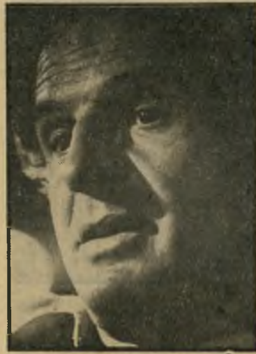
שחקן מי שנה השנה: פרנסואה טריפו "מיפגשים מן הסוג השלישי"