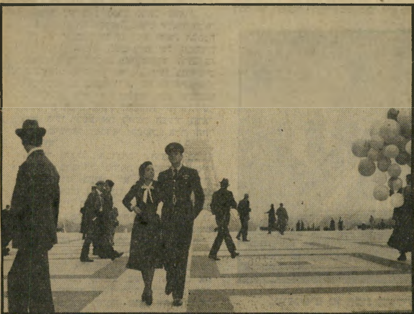
4. מעבר לחצות (ארה"ב)