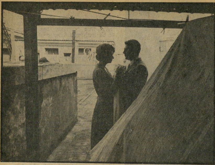
4. יום מיוחד (איטליה)