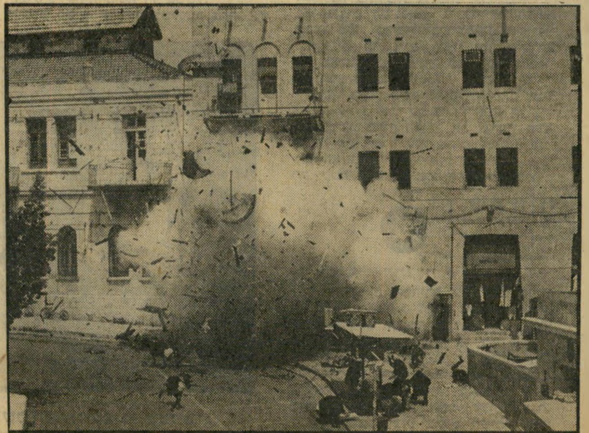
3. האימה ושכרה (ארה"ב)