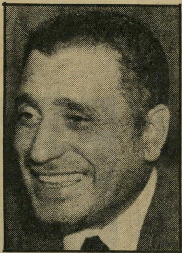
חפניו היכל הישראליים גרועים מהיטור

אנטישמיות ואנטי־אנטישמיות מבחינה כרונולוגית, המאמר שפרץ את הדרך לגל שבא בעיקבותיו היה מאמרו של אַחמד המרוש, שפורסם באוגוסט 1970 שהופיע תחת הכותרת בעייה עקרונית ולא הימור, ובמהלכו הטיף לדרך חדשה בעיקבות מהלכי יוזמת רוג'רס וצ'ינו: "אחרי שנים של מילחמות, כאבים וקורבנות ואחרי גלים בלתי־פוסקים של תעמולה היוצרה עוינות ושינאה, כאשר האליטה מסתירה את האמת, והרצון פאלי מות ובנקם הוא השולט. משום כך, היה זה מעשה מחושב ואמיץ להגיע לתחילת הדרך, מפני שזוהי התייבות נכונה מול המציאות, תוך שמרחיקים מן המחשבה