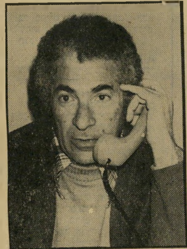
אנים מנצור עיסה אידיאולוגית

קשת הדיעות של אנשי הרוח המצריים, מיוצגת במלואה בקובץ זה — בעיקר בפרק שבו הם מתייחסים בהסתיוגות ל־נטייתם של כמה אנשי־רוח מצריים, ל־"אוב מטיבים אנטישמיים מהספרות הא־רופית ולהשתמש בהם בהקשר של הסיכסוך הערבי־ישראלי...". בקובץ מובאות