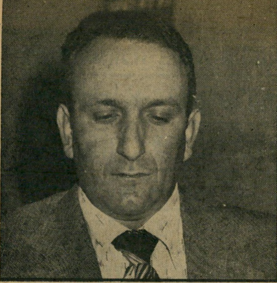
חברי ועד פאפו - לדבר מצחק

הרעש, הוא היה נשכח כמו כל סרט תעודתי בטלוויזיה הישרא-לית ו"