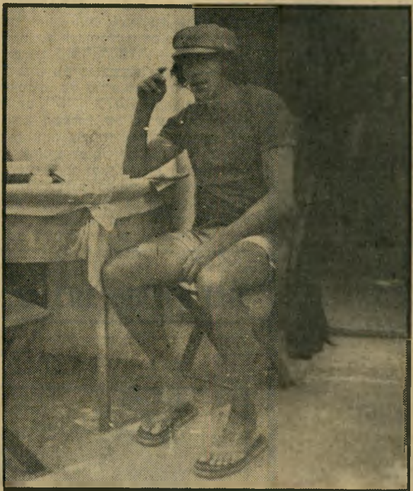
במאי רובינשטיין הפכו את השואה -

לגביו, כל עניין ההתנגדות לסרט נראה כבדיחה שהחלה לקחת את עצמה ברצינות גדולה מדי. "העניין מצחיק", הוא אומר. "עד היום ניראה לי שאם היו מראים את הסרט בטלוויזיה בלי כל