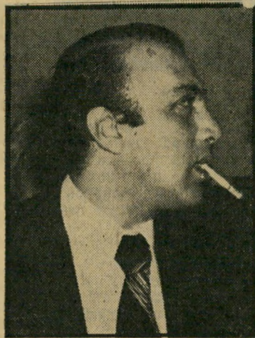
מנחה בראל בלי רק"ח

שר-הביטחון עזר וייצמן הודיע למנהל מחלקת החדשות, חיים יבין, כי הוא אינו מוכן להתראיין לסלוויזיה. ליבין, שניסה לשכנע את וייצמן להסיר את החרם מעל