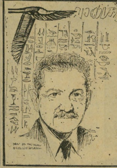
שהב הביניים נץ ואו יונה?

גם עיצוב השער של גיליונות איש-השנה עבר גילגולים רבים עד שהגיע ל-מתכונת בו הופיע בשבוע שעבר. במשך שנים רבות הופיעו לסירוגין שערים שהיו תשלובת של צילומים וציורים. ציירים