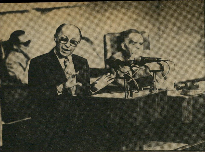
בגין נואם לבסוף: קורן מאושר

„הוא לוחם שנית על קו ברית“ התלוצץ אחד היושבים ביציע.