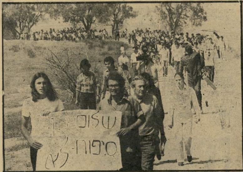
הפגנה נגד גירוש הבדואים בפיתחה (1972)

בחלומי ראיתי את יישובי פיתחת-רפיה. את הגברים, והנשים, התלדים. את היר שדות, הבארות, הכלבים. והנה, לפתע, ברוח סערה, ירד עליהם אריק שרון, ועימו חיל רב מאד. כעדת זאבים על עדר כבשים, שטשו על היישובים. להשמיד. לחסל. לגרש. את הבארות סתמו באבנים ובעפר. את העצים עקרו ואת השדות שרפו. את הבתים פוצצו וניפצו. עד כי לא נשארה אבן על אבן. את הנשים הבוכיות ואת הילדים המבוהלים, ובעלי העיניים הקרועות לרוחה בי אימה, הם העמיסו על משאיות שהובילום מן המקום, למקום לא ידוע. את הגברים היכו ואסרו. בכלבים ירו. וכאשר ירדה השמש על פיתחת-רפיה, לא שרדו בה אלא חורבות, גושי ביטון פזורים, בארות סתומים, שדות עשנים, וגוויות של כלבים ותרנגולות פזורות בשטח. אריק שרון היה ושם.